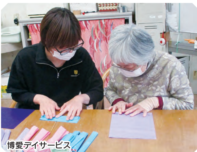
博愛デイサービス

6月に入り梅雨の季節となりましたが、本号が発行される頃には、自然文化園で「アジサイ園」が開催（6月12日〜30日）されています。 博愛福祉会のご利用者の皆様も、今年の紫陽花の色づきはどうかかなぁと「紫陽花ドライブ」での外出などを心待ちにしながら、作品作りを楽しんでいます。