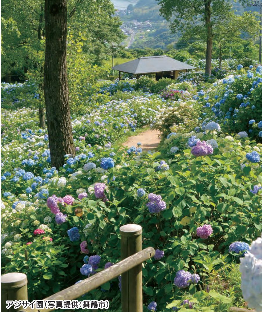
アジサイ園