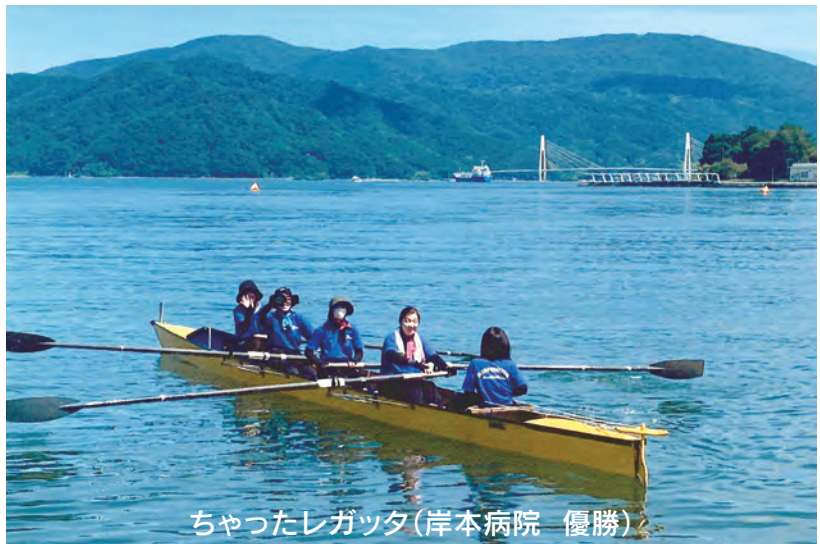
ちゃったレガッタ(岸本病院 優勝)