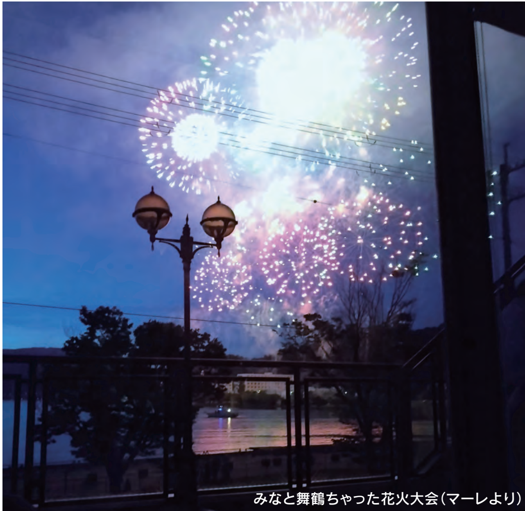
みなと舞鶴ちゃった花火大会(マーレより)