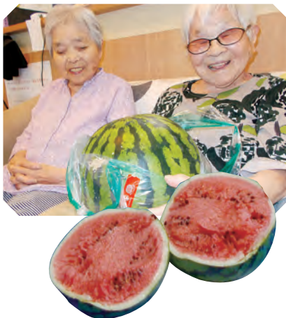
ケアハウス愛宕 スイカ割り