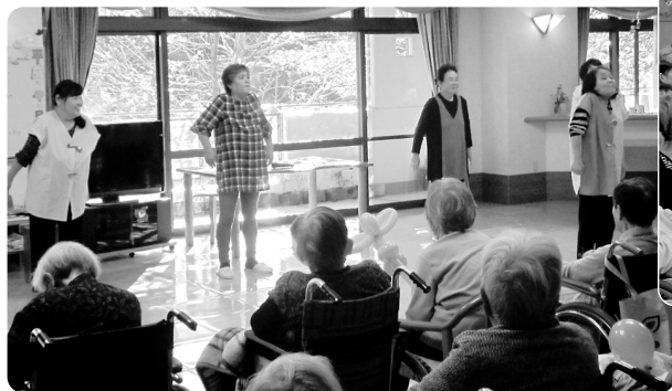
体操で体をほぐしました