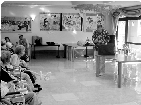
バルーンアートや手品におどろきました

いた後には、いつもの体操で身体をほぐしました。市寿会の皆さん、またのご来苑お待ちしております☆